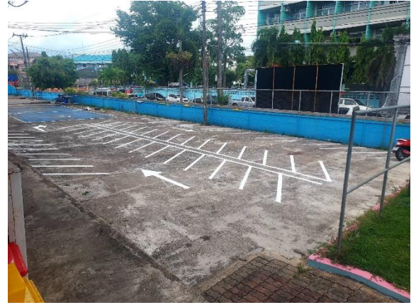
บริเวณหลังพระพุทธรูป