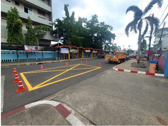
บริเวณหน้าโรงเรียน

โรงเรียนสอาดเผดิมวิทยาดำเนินการกิจกรรมคืนพื้นที่จราจรสู่สาธารณะ โดยจัดพื้นที่จอดรถในโรงเรียนให้กับนักเรียน คืนพื้นที่การจราจรบริเวณหน้าโรงเรียนให้สาธารณชนทั่วไปได้ใช้เป็นปกติ ซึ่งได้รับความอนุเคราะห์ดีเส้นสถานที่จอดรถบริเวณหลังพระพุทธรูปประจำโรงเรียน จากแนวทางหลวงชุมพร